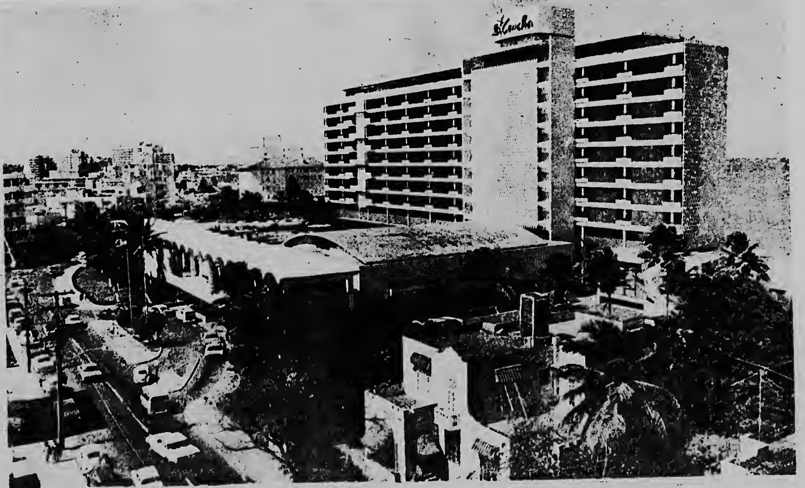
Hotel La Concha, na San Juan, Puerto Rico lo wordu amplia cu 144 camber mas. E cambernan aki lo ser construi na man drechi y e total di cambernan di e hotel aki lo bira 396. E hotel aki ta un dje hotelnan cu a wordu construi door di Fomento, un departamentu di gobierno y e hotel ta wordu opera door di Associated Federal Hotels di Dallas, Texas. E arquitecto lo ta Toro & Ferrer e mesunnan cu a diseña Curacao Hilton.